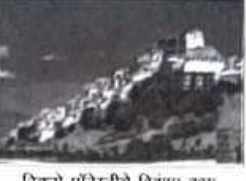
ठिकसे मॉनॅस्ट्रीचे विहंगम दृश्य

केवळ त्याच्या धार्मिक महत्त्वाकडेच नव्हे तर समोसाकडच्या परिस्थितीची वैचारिक दृष्टी प्रदान करण्याच्या दिकाणाकडे देखील पर्यटकांचे ध्यान आकर्षण करते आहे.