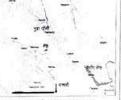
लेह-लडाख प्रवासाचा रोड मॅप (नकाशा)

निष्णातील निःशब्द शांततेचा आस्वाद घेण्यासाठी लेह-लडाख या निस्संशय पर्यटन स्थळाला अवश्य भेट द्या.