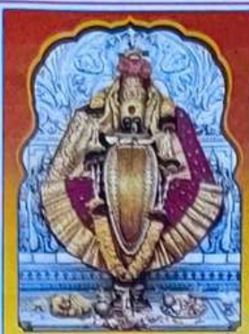
॥ श्री महालक्ष्मी प्रसन्न ॥